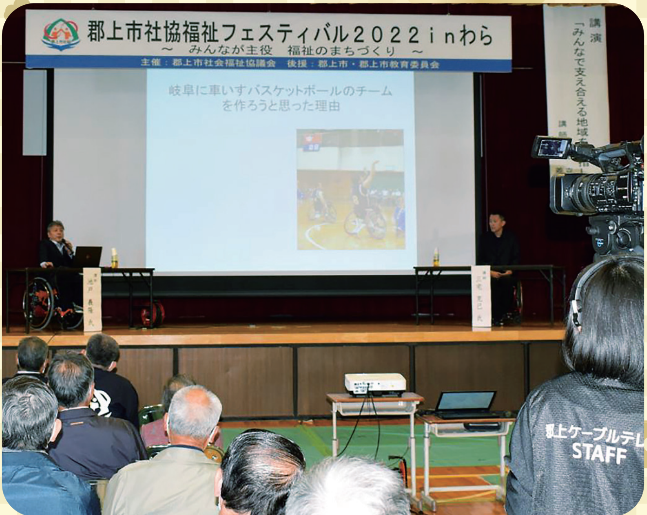
▲当日の会場の様子は、郡上ケーブルテレビ・Youtubeでライブ配信しました。