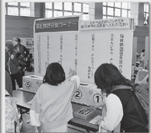
来場者の皆さんも投票

市内の中学一年生、313名から応募があり、市民の皆さんの投票により最優秀賞・優秀賞が決定しました！